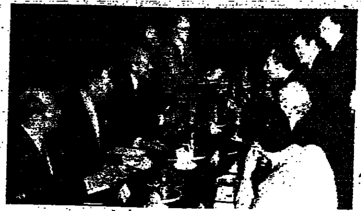
الرئيس السادات وسبوت فانس في اجتماع مشترك مع أعضاء الوفدين المصري والسوري أثناء الجولة الأولى من المباحثات

كان من أهم النتائج التي ايجرت عنها مباحثات الرئيس انور السادات وسبوت فانس وزير الخارجية المصرية خلال الـ ١٠ أيام التي مضت والتي اعتمدا في المؤتمر الصحفي الذي عقدهم في القاهرة في ١٠ أغسطس في استراحة الرئيس المصري بالقاهرة. في استراحة الرئيس المصري بالقاهرة. في استراحة الرئيس المصري بالقاهرة. في استراحة الرئيس المصري بالقاهرة.